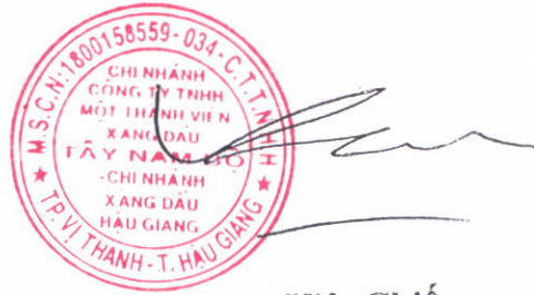
Trương Việt Chiến